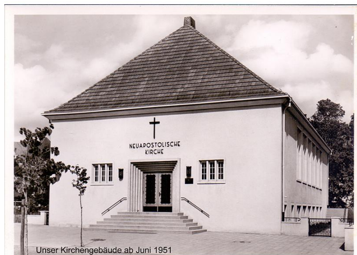
Unser Kirchengebäude ab Juni 1951