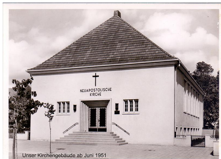
Kirchengebäude ab Juni 1951

Ab Anfang Oktober 1898 fanden in der Schauenburger Straße 47 die ersten Gottesdienste der Neuapostolischen Kirche in Kiel statt. Zuvor, am 26. November 1897, erhielt Priester August Struckmann aus Wolfenbüttel vom Stammapostel Krebs, dem damaligen Oberhaupt der Neuapostolischen Kirche, den Auftrag, nach Kiel zu gehen und hier eine Gemeinde zu gründen. Den Auftrag erfüllte er erfolgreich. In diesem Jahr können wir das 125-jährige Bestehen feiern.